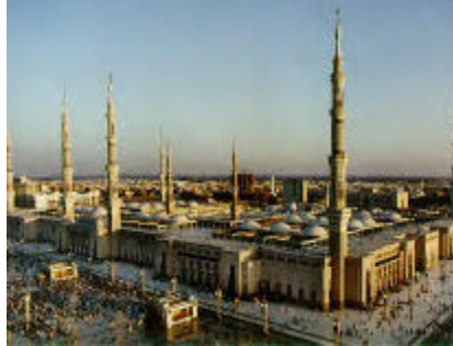
A gauche: Al Masjid Al Haram: la mosquée sacrée de la Mecque construite autour de la Ka'ba (la Maison de Dieu). A droite: la mosquée du Prophète Mohammed (PBDsL) à Médine. Le Prophète (PBDsL) y est enterré.